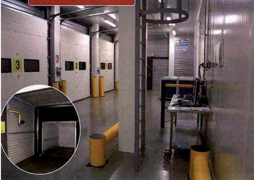
Les huit quais d'expédition sont aménagés avec des plates-formes mobiles pour un chargement à l'abri des intempéries. Un chauffage évite les gros chocs thermiques.