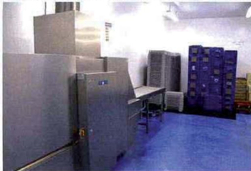
← Une salle est dédiée au nettoyage des clayettes, avec un tunnel de lavage Hobart.