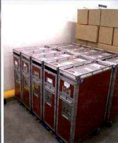
FB Solution livre les trolleys Eurostar directement remplis. Les zones de conditionnement sont dédiées par marché. Elles vont être automatisées. Par exemple, la zone ferroviaire va accueillir une filmeuse automatique associée à un détecteur de métaux-corps étrangers.