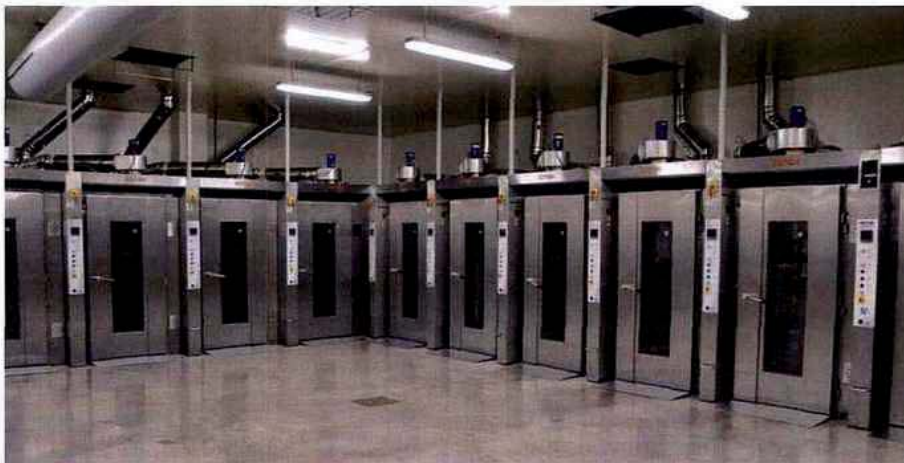
Les onze fours de la société haut-savoyarde Guyon incluent des pierres réfractaires pour une meilleure conservation de la température.

Deux cellules de surgélation Hengel sont dédiées à l'activité « cuit surgelé », pour des produits à forte teneur en beurre à destination de certaines enseignes de restauration rapide.