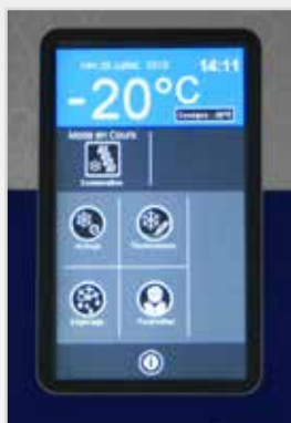
简单易用的新界面