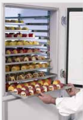
保全原味且不失水份