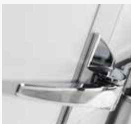
镀铬把手和可调节接合点